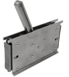
Outils de maintien Roxtec